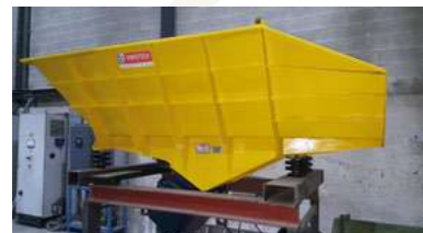
Convoyeur doseur électromagnétique